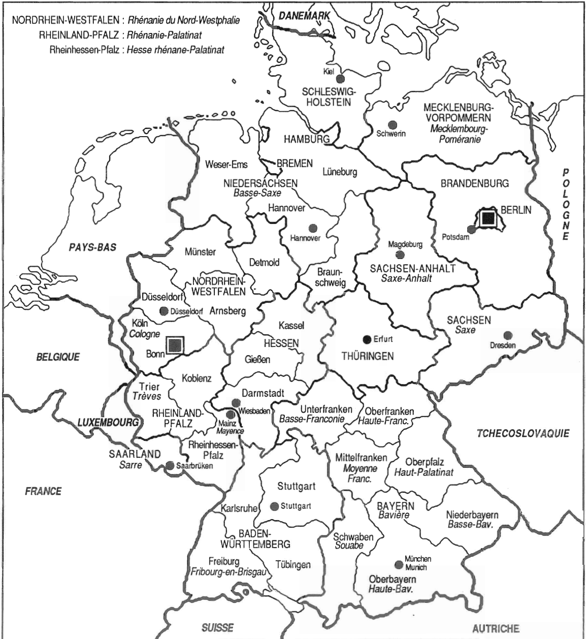
Allemagne . Carte des Länder et des Regierungsbezirke